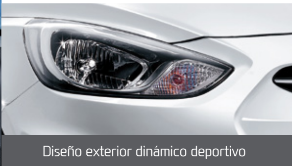
Diseño exterior dinámico deportivo