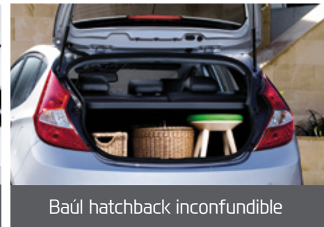
Baúl hatchback inconfundible