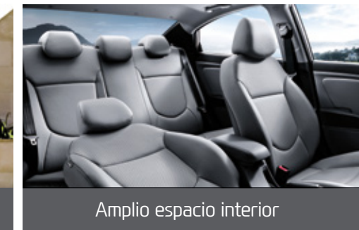
Amplio espacio interior